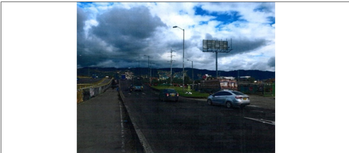
Foto 1. Vista panorámica del predio, del panel desmontado y de la valla ubicada en la Av. Carrera 45 No. 169-81 (dirección catastral) orientación Oeste-Este - del Rad. 2021ER21362